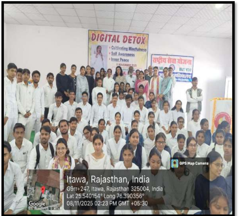
1 डिजिटल डिटॉक्स विषय पर संगोष्ठी – स्थानीय प्रेस कवरेज