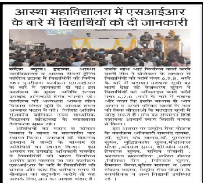
Figure 2 एसआईआर विषय पर संगोष्ठी- स्थानीय प्रेस कवरेज।"

कार्यक्रम के माध्यम से विद्यार्थियों में एसआईआर अभियान, मतदाता पंजीकरण और संशोधन प्रक्रिया के प्रति स्पष्ट समझ विकसित हुई। अनेक विद्यार्थियों ने स्वयं एवं परिवार के सदस्यों का नाम मतदाता सूची में जोड़ने की पहल करने का संकल्प लिया। कार्यक्रम ने युवा मतदाता जागरूकता और नागरिक जिम्मेदारी को मजबूत किया।