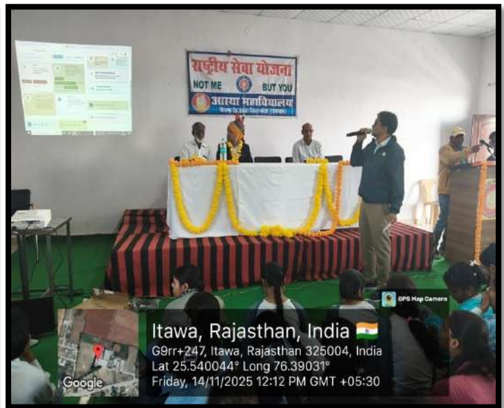
Figure 1 "महाविद्यालय में आयोजित एसआईआर संगोष्ठी की झलक।"