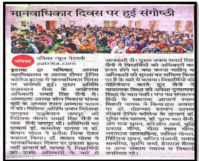
स्थानीय समाचार पत्र में प्रकाशित मानवाधिकार दिवस समारोह में विद्यार्थियों को अधिकारों और कर्तव्यों की जानकारी दी गई।