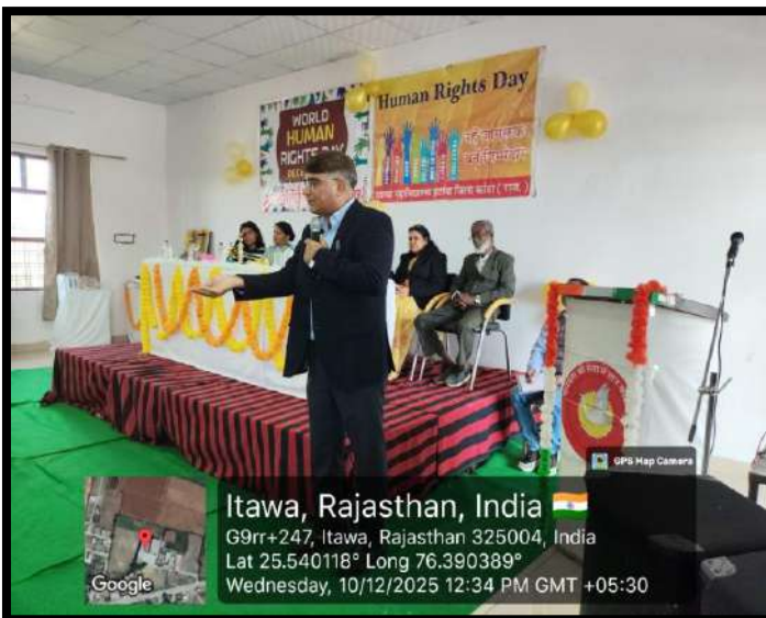
मानवाधिकार दिवस संगोष्ठी में वक्ताओं ने अधिकारों और कर्तव्यों पर प्रकाश डाला

इस आयोजन से विद्यार्थियों में मानवाधिकारों के प्रति जागरूकता और संवेदनशीलता बढ़ी। अधिकारों की सुरक्षा के उपायों की व्यावहारिक जानकारी मिली। मूल्य आधारित शिक्षा और सामाजिक जिम्मेदारी की समझ विकसित हुई। विद्यार्थियों में सजग एवं उत्तरदायी नागरिक बनने की प्रेरणा सुदृढ़ हुई।