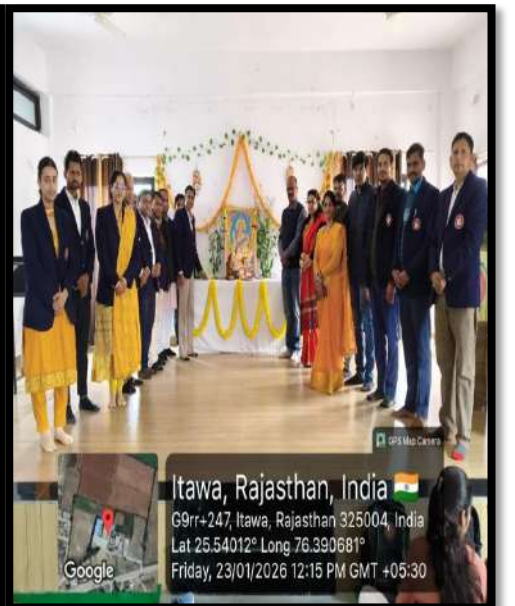
1 विद्या की देवी माँ सरस्वती की आराधना और दीप प्रज्वलन कर हर्षोल्लास के साथ मनाया गया बसंत पर्व।