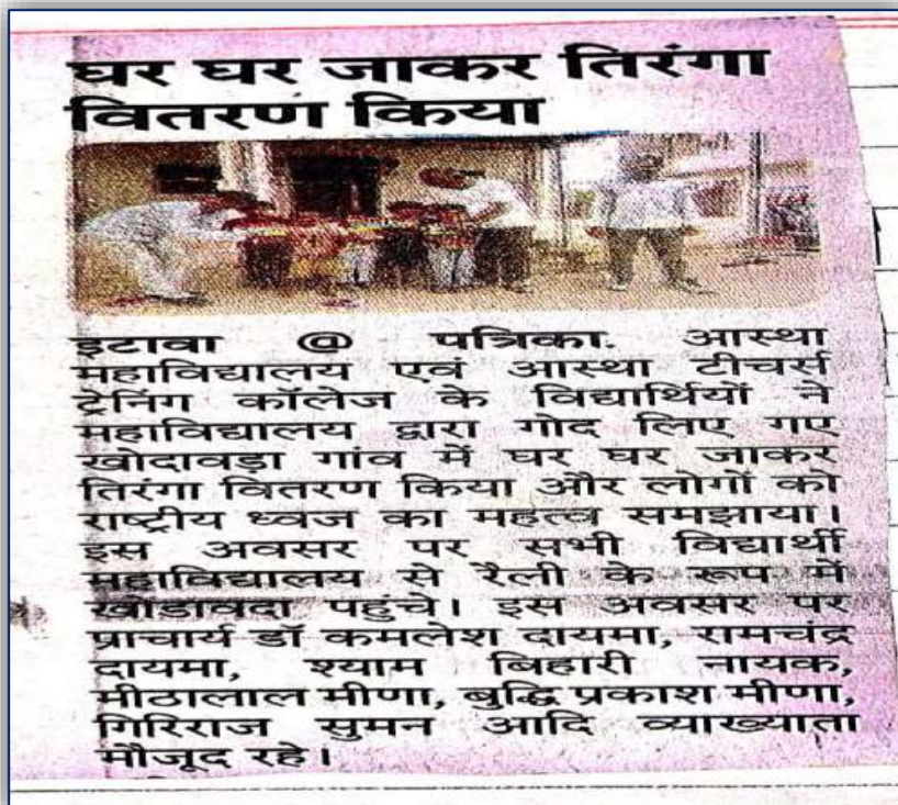
1स्थानीय अखबार में प्रकाशित- विद्यार्थियों ने गोद लिए गए खावबड़ा गांव में घर-घर जाकर तिरंगा वितरण कर राष्ट्रीय ध्वज का महत्व समझाया।

इस कार्यक्रम के माध्यम से ग्राम स्तर पर राष्ट्रीय ध्वज के प्रति सम्मान और जागरूकता में उल्लेखनीय वृद्धि हुई। नागरिकों में राष्ट्रभक्ति एवं जिम्मेदार नागरिकता का संदेश सुदृढ़ हुआ। विद्यार्थियों में नेतृत्व, अनुशासन, सामाजिक जुड़ाव और सामुदायिक सेवा की भावना विकसित हुई। महाविद्यालय और ग्राम समुदाय के बीच सहयोग एवं विश्वास भी मजबूत हुआ। कार्यक्रम जनभागीदारी और राष्ट्रीय चेतना के दृष्टिकोण से पूर्णतः सफल रहा।