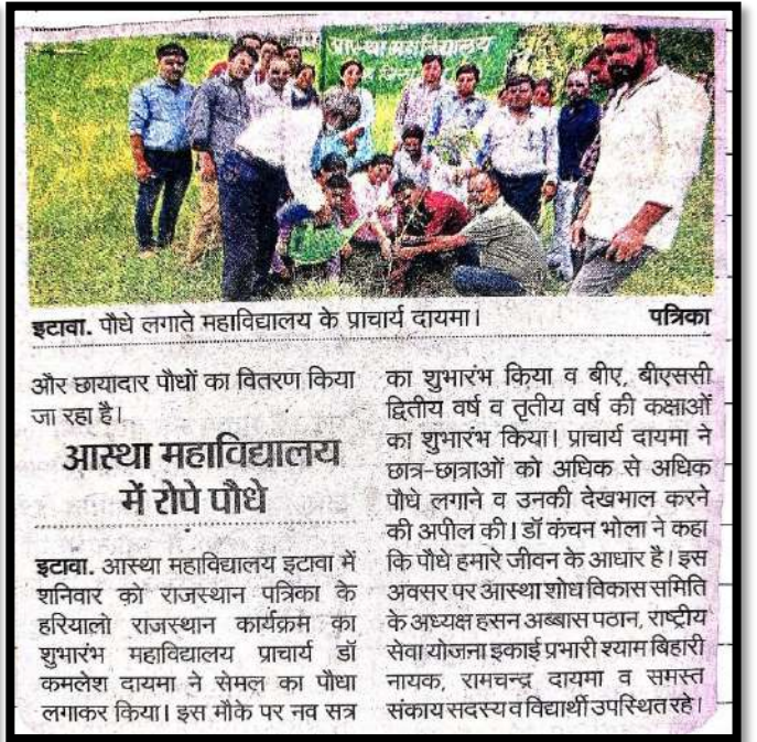
इटावा. पौधे लगाते महाविद्यालय के प्राचार्य दायमा।