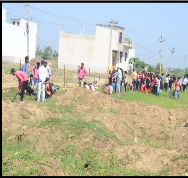
महाविद्यालय के छात्र-छात्राएँ वृक्षारोपण स्थल पर सामूहिक रूप से पौधारोपण करते हुए।

अंततः, वृक्षारोपण अभियान सफलतापूर्वक संपन्न हुआ। यह कार्यक्रम विद्यार्थियों एवं स्टाफ सदस्यों में पर्यावरण संरक्षण के प्रति दीर्घकालिक प्रतिबद्धता विकसित करने में सहायक सिद्ध हुआ। लगाए गए पौधे भविष्य में महाविद्यालय परिसर में स्वच्छ, हरित एवं स्वस्थ वातावरण के निर्माण में महत्वपूर्ण योगदान देंगे।