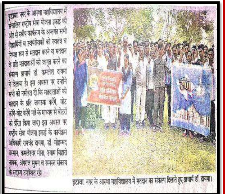
1 'स्वीप' कार्यक्रम में विद्यार्थियों का मतदान जागरूकता संकल्प स्थानीय समाचार में प्रकाशित हुआ।"