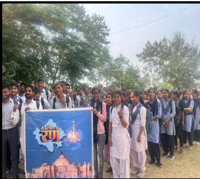
स्वीप कार्यक्रम में छात्र-छात्राओं और स्वयंसेवकों ने मतदान जागरूकता का संकल्प लिया।

इस कार्यक्रम से विद्यार्थियों में मतदान के प्रति जागरूकता एवं जिम्मेदारी की भावना मजबूत हुई। शपथ ग्रहण एवं जागरूकता गतिविधियों ने लोकतांत्रिक मूल्यों को व्यवहारिक रूप से समझने का अवसर प्रदान किया। विद्यार्थियों ने भविष्य में मतदान करने तथा अन्य लोगों को भी जागरूक करने का संकल्प लिया। यह अभियान जिम्मेदार एवं जागरूक नागरिक निर्माण की दिशा में प्रभावी सिद्ध हुआ।