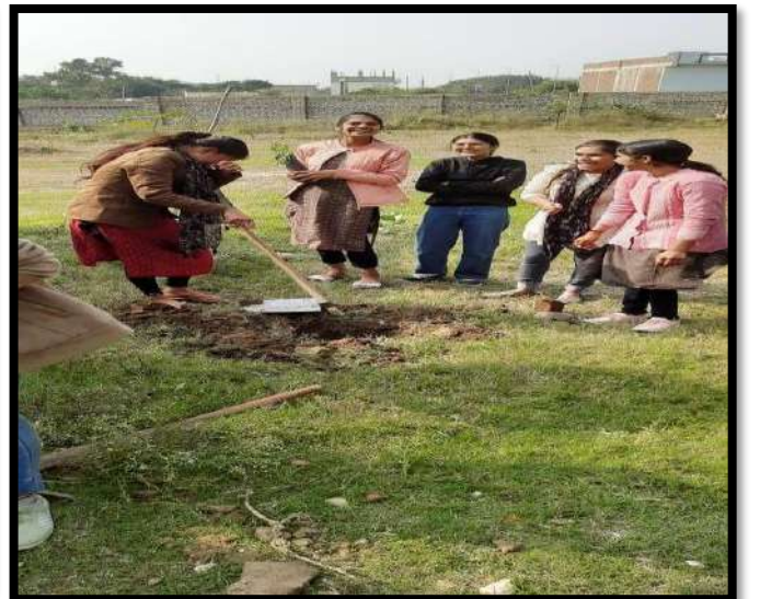
स्थानीय समाचार पत्र 'नवज्योति' में प्रकाशित: ग्राम खोड़ावदा में श्रमदान के साथ आस्था महाविद्यालय के NSS शिविर का उत्साहजनक शुभारंभ।