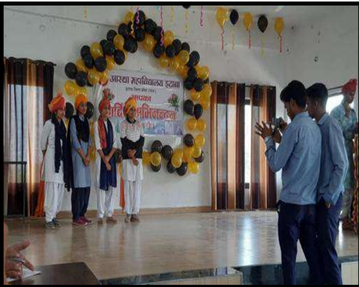
आस्था महाविद्यालय में चार दिवसीय खुला सत्र कार्यक्रम के दौरान सांस्कृतिक गतिविधियों में भाग लेते विद्यार्थी।

इस कार्यक्रम से विद्यार्थियों में आत्मविश्वास, नेतृत्व क्षमता एवं रचनात्मक अभिव्यक्ति का विकास हुआ। विद्यार्थियों को सांस्कृतिक मूल्यों एवं सामाजिक उत्तरदायित्व को समझने का अवसर मिला। टीम भावना, मंच संचालन कौशल तथा अनुशासन की भावना सुदृढ़ हुई। यह कार्यक्रम विद्यार्थियों के व्यक्तित्व विकास की दिशा में अत्यंत प्रभावी सिद्ध हुआ।